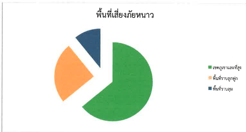
ตารางลักษณะพื้นที่เสี่ยง

อำเภอพื้นที่เสี่ยงที่คาดว่าจะประสบปัญหาจากสภาพอากาศที่หนาวจัด อุณหภูมิต่ำกว่า ๑๕ องศาเซลเซียส และลดลงต่อเนื่องจนประชาชนได้รับผลกระทบอย่างรุนแรงเป็นบริเวณกว้าง ได้แก่ อำเภอไทรโยค อำเภอทองผาภูมิ อำเภอสังขละบุรี และอำเภอศรีสวัสดิ์