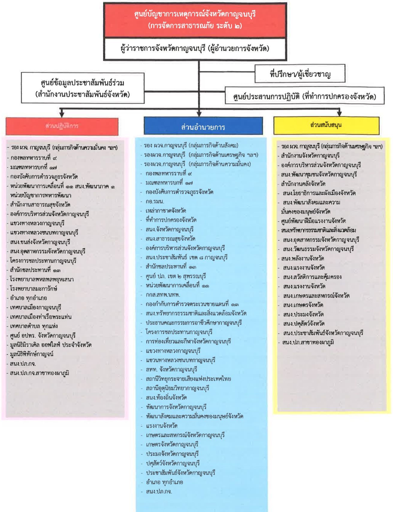
แผนภูมิ ๑ โครงสร้างศูนย์บัญชาการเหตุการณ์ภัยหนาวจังหวัดกาญจนบุรี